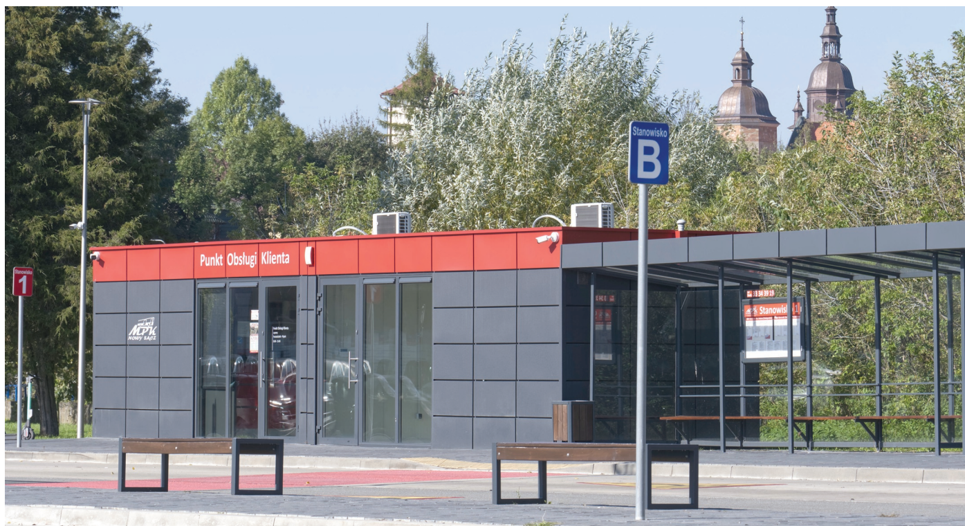
Fot. 2. Punkt Obsługi Klienta na dworcu autobusowym.

Kosztująca 1,5 mln zł inwestycja w całości została oddana do użytku 7 grudnia 2021 r. wraz z Punktem Obsługi Klienta, czynnym od poniedziałku do piątku