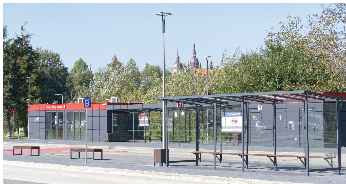
Fot. 3. W drugim kontenerze mieści się płatna toaleta publiczna...