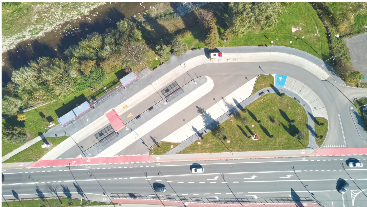
Fot. 1. W 2019 r. podjęto decyzję o przywróceniu dworca autobusowego przy Bulwarze Narwiku w miejsce bezpłatnego parkingu dla samochodów osobowych.

– Bez wątpienia głos mieszkańców był niezwykle istotny w podjęciu dalszych decyzji. Jednak to dzięki